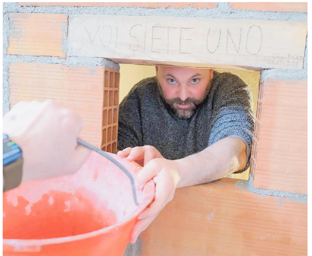
La finestra attraverso la quale alcune persone gli garantiscono acqua, cibo e assistenza

catorio Franz, scrittore non nuovo alle provocazioni -. Malgrado tutti i mezzi di comunicazione di cui disponiamo, non comunichiamo più e siamo incapaci di provare empatia. Ho deciso di denunciare questa situazione facendomi tumulare vivo come era in uso fare nell'Europa del XI secolo fra i reclusi, asceti radicali che hanno dato origine alla clausura. Chiudendo questo spazio fisico posso concentrarmi su una dimensione interiore».